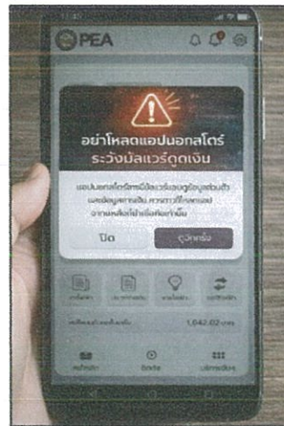
Pop - up บนแอป PEA (๒๓ - ๒๘ ก.พ. ๖๙)