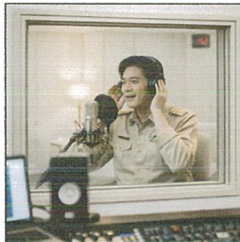
รายการวิทยุของกรมประชาสัมพันธ์ (๑๕ ก.พ. ๖๙)