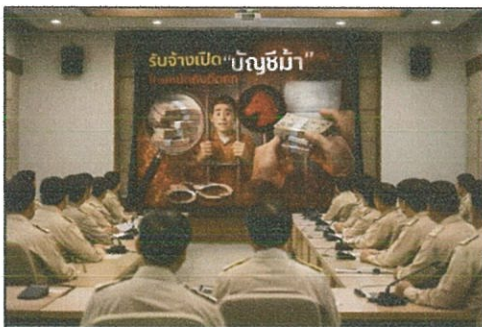
การประชุมหัวหน้าส่วนราชการประจำเดือน (๒๗ ก.พ. ๖๙)