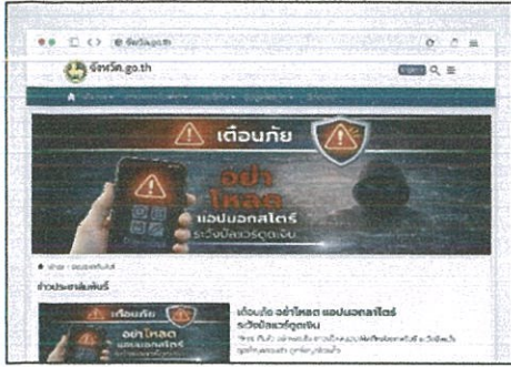
เว็บไซต์จังหวัด วันที่เผยแพร่ (๑๔ ก.พ. ๖๙)