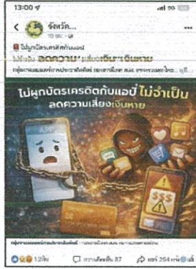
เพจ FB จังหวัด (๑๔ ก.พ. ๖๙)