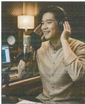
วิทยุชุมชน (๑๖ - ๒๒ ก.พ. ๖๙)