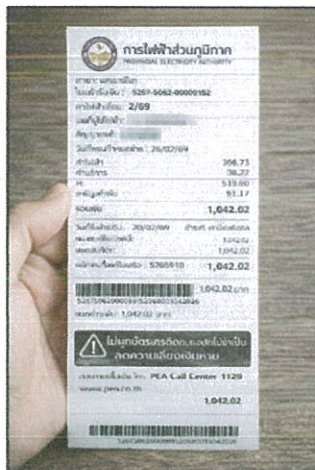
ใบเสร็จค่าไฟ (๑ - ๒๘ ก.พ. ๖๙)

(เช่น Key Message ท้ายใบเสร็จ, Pop - up บนแอป)