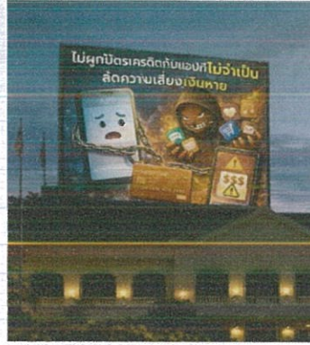
จอ LED หน้าศาลากลางจังหวัด (๑๒ - ๑๕ ก.พ. ๖๙)