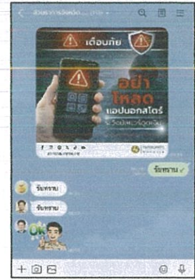
ไลน์กลุ่มส่วนราชการ (๒๐ ก.พ. ๖๙)