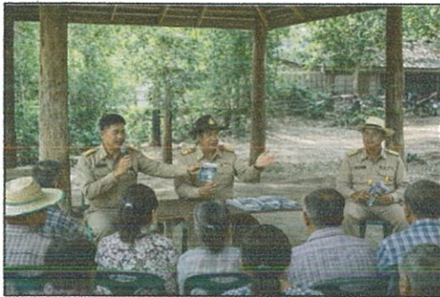
ถ่ายทอดความรู้เกี่ยวกับภัยออนไลน์ให้กับชาวบ้าน (๑๙ ก.พ. ๖๙)