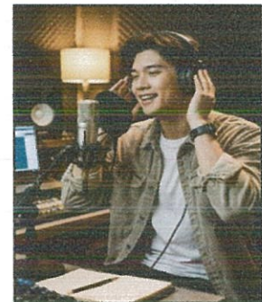
วิทยุชุมชน (๒๖ ก.พ. ๖๙)